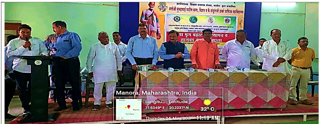
All Dignitaries present on the dais while welcome ceremony